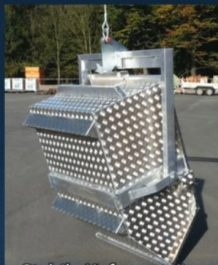
Stabile Kufen ermöglichen das Unterfahren mit dem Gabelstapler