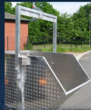
Schuttmulden AS 1500 und AS 2000 mit extra verstärktem Boden