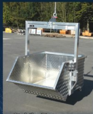
Stabiler Tragarm aus hochfestem Aluminium-Profil