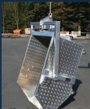
Kipp-Vorrichtung mit automatischer Ver- und Entriegelung